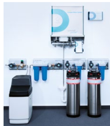
DRAABE TrePur Compact