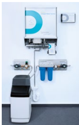
DRAABE DuoPur Compact

Mit wenigen Handgriffen ist der benutzte DRAABE Pur Container gegen ein rundum gewartetes System ausgetauscht. Hygiene und Sicherheit sind so immer garantiert – ohne zusätzliche Kosten, Zeit und Aufwand.