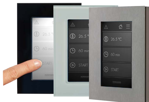
Écran tactile externe en trois versions

Le cadre est fixé sur l'écran grâce à des aimants ce qui permet aisément d'adapter la couleur du cadre choisi.