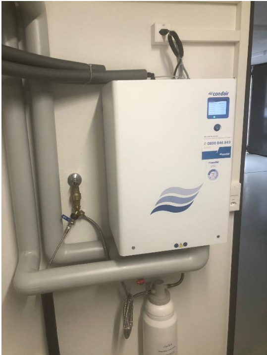
Abb. 6: Prüfanlage 3, Freienbach