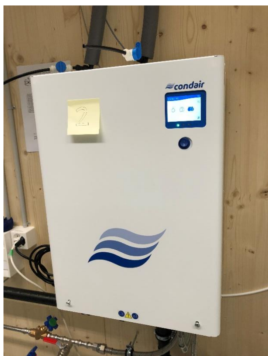
Abb. 4: Prüfanlage 2, Pfäffikon