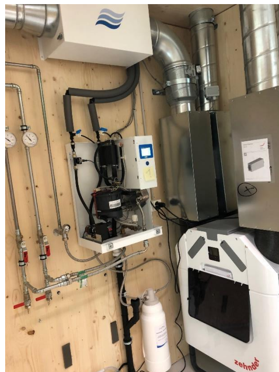
Abb. 3: Anbindung an Lüftungs- gerät von Prüfanlage 1