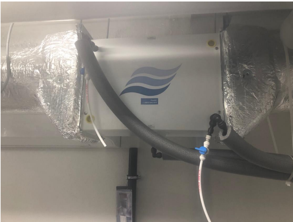
Abb. 8: Befeuchtereinheit von Prüfanlage 3