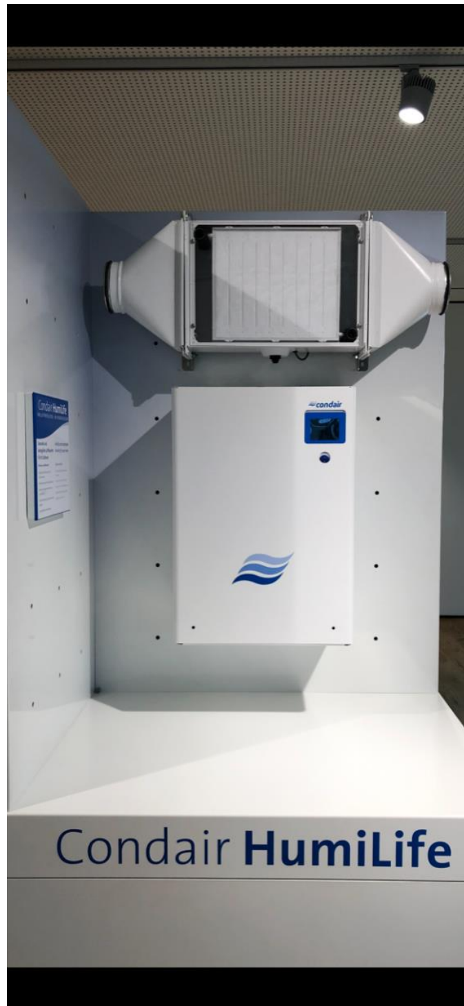
Abb. 1: Systemaufbau