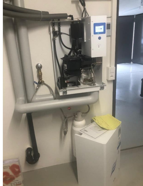
Abb. 7: Prüfanlage 3, offen