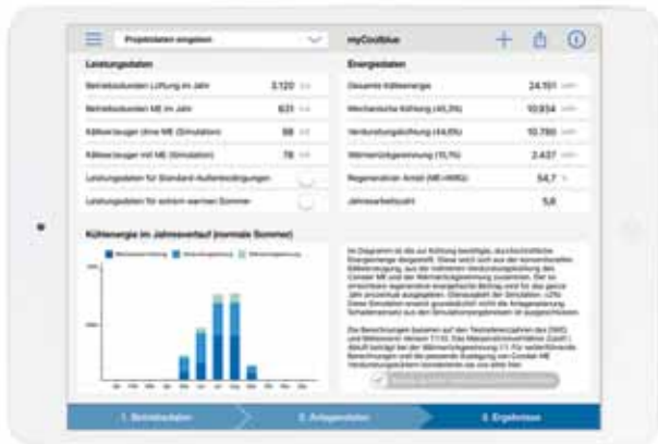
Ergebnisse einer Berechnung zur Verdunstungskühlung auf Basis der App „myCoolblue“ als Screenshot

lichen projektspezifischen Strom- und Wasserkosten eine wichtige Rolle. Grundsätzlich sollte aber die Verdunstungskühlung nicht allein betrachtet werden, sondern als Verbundsystem, zusammen mit der Wärmerückgewinnung, denn ohne diese ist die indirekte Verdunstungskühlung physikalisch nicht anwendbar. Durch den Einsatz der Verdunstungskühlung wird die Amortisationszeit des Verbundes mit der Wärmerückgewinnung unwesentlich verlängert. Daher ist die Bandbreite möglicher Amortisationszeiten groß und sollte für jedes Projekt individuell ermittelt werden. Hersteller von Verdunstungskühlsystemen bieten für Kunden solche Wirtschaftlichkeitsberechnungen an. Mögliche Auslegungsvarianten können aber auch schon im Vorfeld mit der Simulations-App durchgespielt und energetisch berechnet werden.