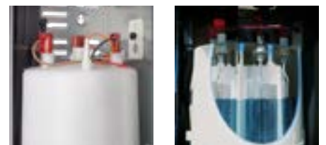
Cylindre à vapeur à longue durée de vie

Une fois le processus de purge terminé, le système est automatiquement rempli d'eau fraîche sans interrompre le fonctionnement.