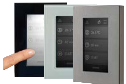
Das externe Display in drei Versionen

Dieses ist als Unterputz- oder Aufputzvariante, mit nur 19 mm Aufbauhöhe erhältlich. Zur Auswahl gibt es drei Zierblenden: Chromstahl gebürstet, schwarzes oder weisses Glas. Passend zur ausgewählten Zierblende sind zwei Anzeigenlayouts verfügbar. Das einzigartige Rahmensystem erlaubt dem Dampfbadbauer aber auch ein individuelles Material als Blende einzusetzen und an dem hierfür mitgelieferten magnetischen Zentrierahmen zu befestigen.