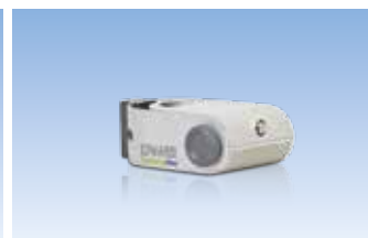
Série DR Humidification solo directe dans la pièce

En tant que fabricant chef de file de systèmes d'humidification commerciaux et industriels depuis plus de 40 ans, Nortec dispose de la technologie et de l'expertise d'application répondant aux besoins de n'importe quelle application.