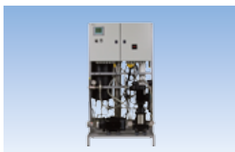
Série HP Humidification haute pression