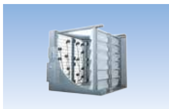
Série DL Refroidissement par évaporation et humidification