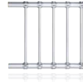
Condair OptiSorp Dampf-Verteilssystem für eine homogene Verteilung auf kürzeste Befuchtungsstrecken