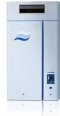
Condair Fan mit Ventilationsgerät für Direkt-Raumbefeuchtung